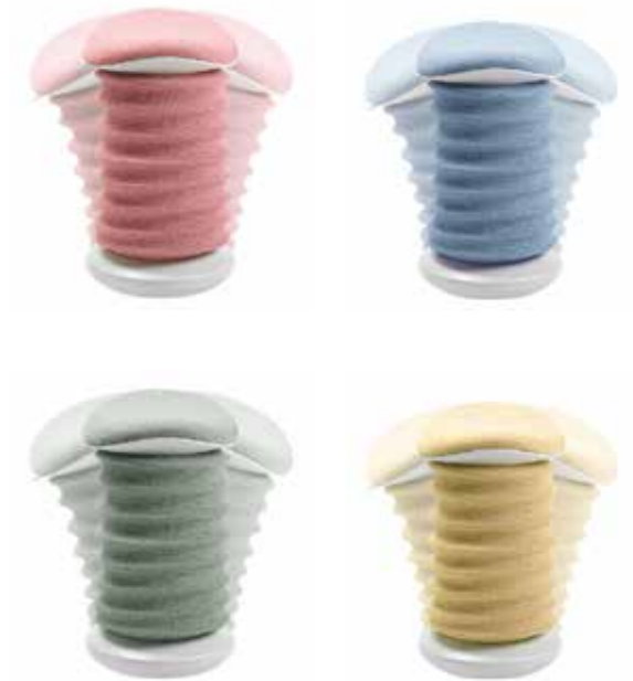
Sitniss 4D AGR

Unser Sitzverhalten ist von wenig Bewegung und einer eingeschränkten Muskelarbeit geprägt. Jeder Mensch verbringt täglich über zehn Stunden in sitzender Haltung. Viel Zeit, die man auf keinen Fall auf nicht ergonomischen Bürodrehstühlen verbringen sollte – denn das führt zu einer falschen Körperhaltung und daraus resultierenden Rückenschmerzen. Die ersten Anzeichen von Rückenbeschwerden sind Verspannungen der Rückenmuskulatur, ausgelöst durch eine Unterversorgung der Muskeln mit Flüssigkeit und Nährstoffen.