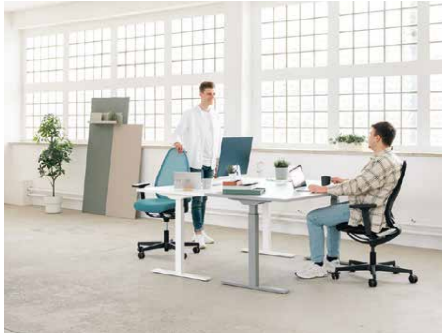
Soft Sitness Art AGR

Unter www.agr-ev.de/produkte erfahren Sie, worauf es wirklich ankommt. In über 100 Themenfeldern Ihres Alltags entdecken Sie wertvolle Tipps, Informationen und ausgezeichnete Produkte rund um die Rückengesundheit.