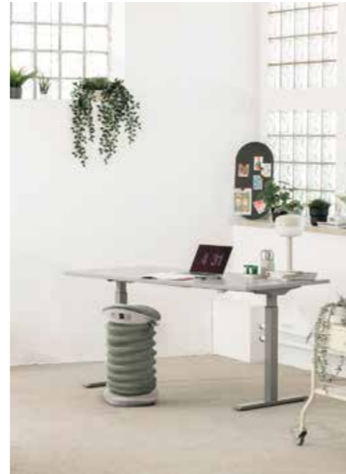
Sitness 4D AGR