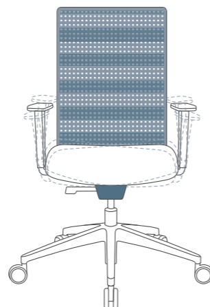
Sitness AirWork AGR