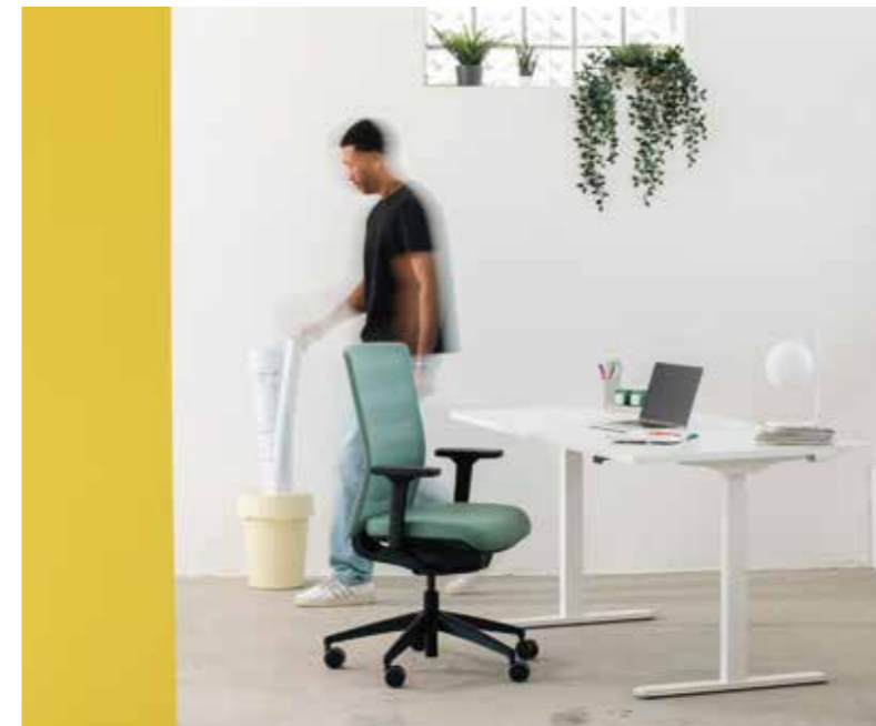
Sitniss AirWork AGR

Sitniss schafft Bewegungsfreiheit in jede Richtung!